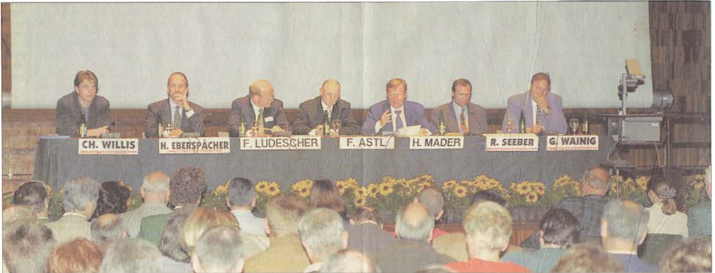
HOCHKARÄTIG BESETZT war das Podium mit den Vortragenden anlässlich der 4. Funktionärs-Info-Tagung im Innsbrucker Congress.